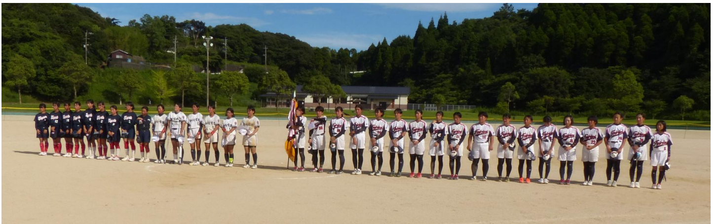
第三位・宮之城中学校