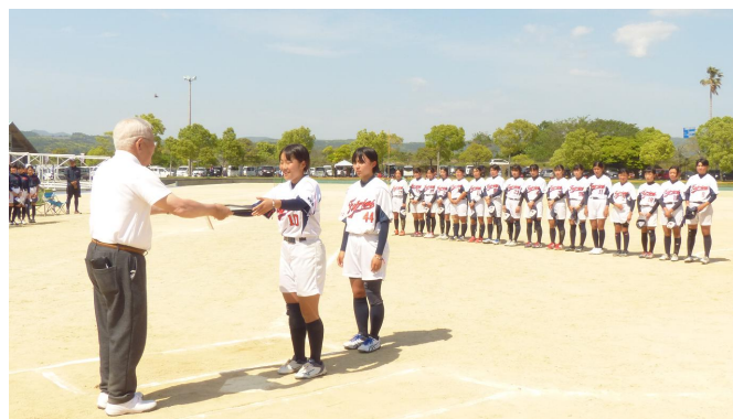
準優勝・薩摩フェアリーズ