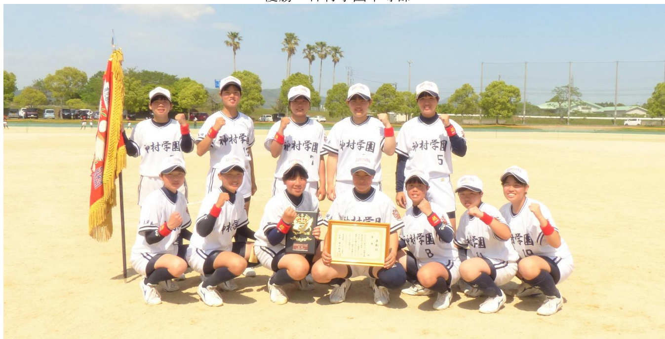
優勝・神村学園中等部