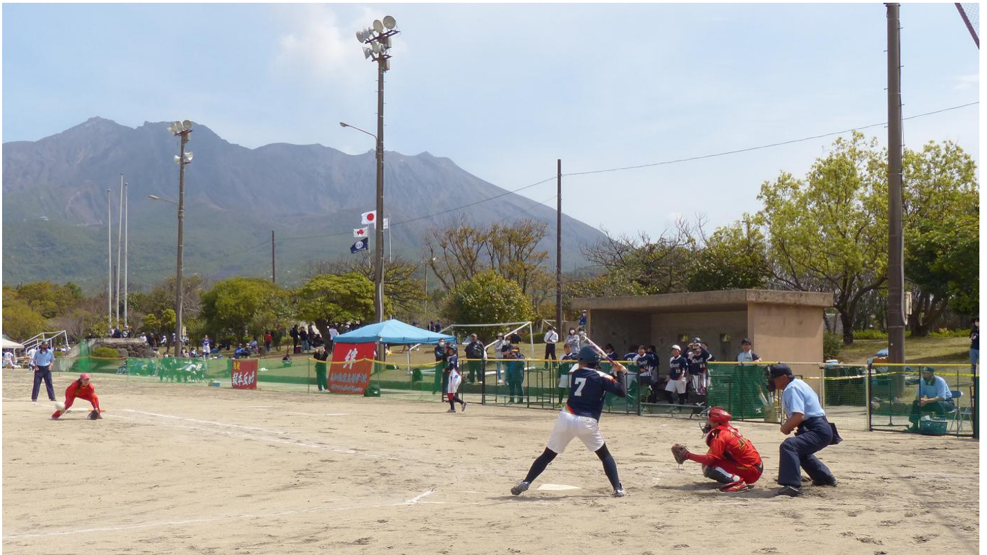
3月17日(金曜日)監督会議 鹿児島市 桜島