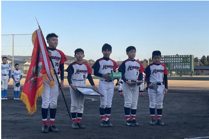
優勝・東出水ソフトボール少年団