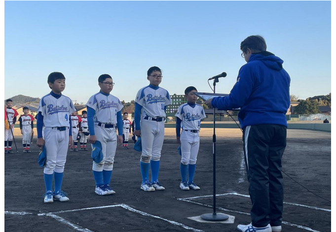
準優勝・米ノ津・出水中央ソフトボール少年団