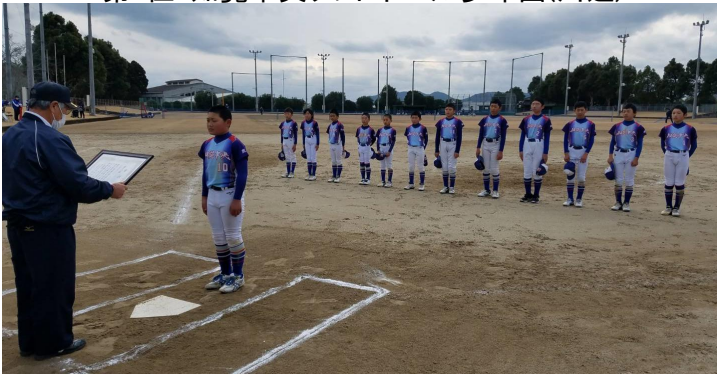
第3位・知覧中央ソフトボール少年団(川辺)