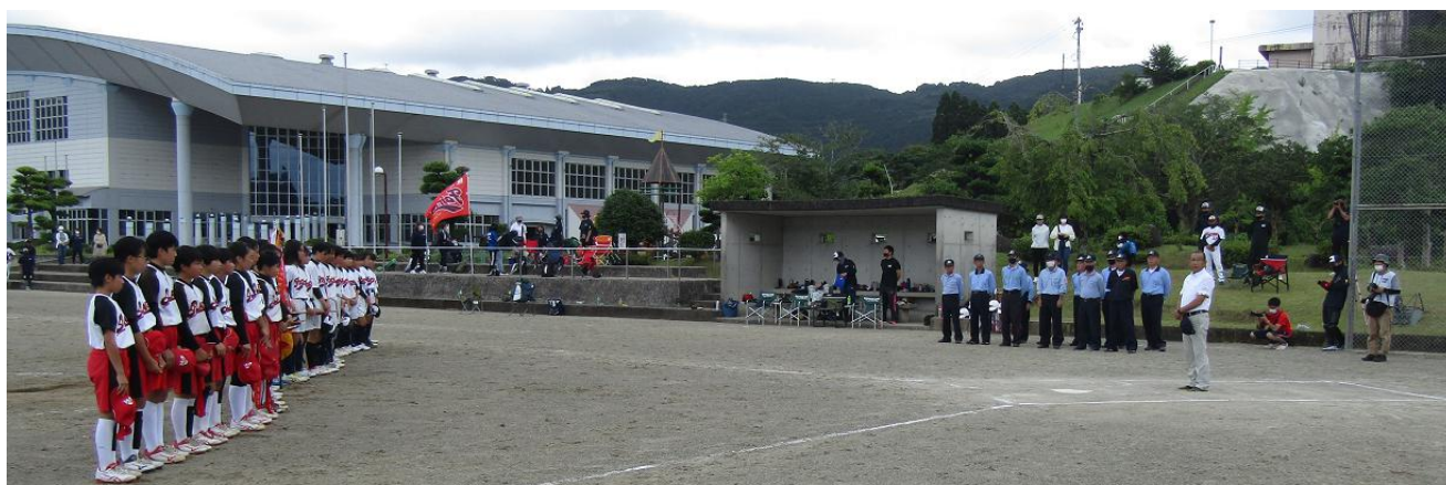
優勝・薩摩フェアリーズ