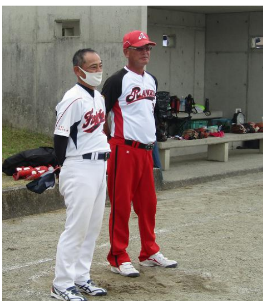
準優勝・大隅レッドエンゼルス