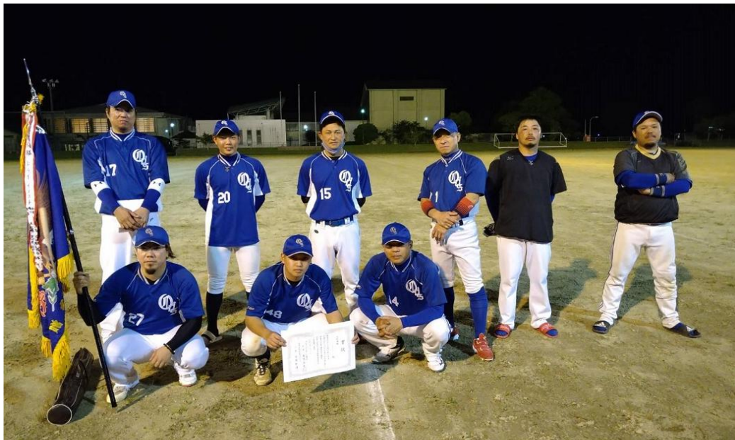
Aクラス優勝・大口電子SC