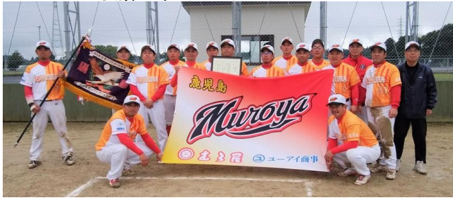
優勝・焼亭・寿司亭 むろ屋