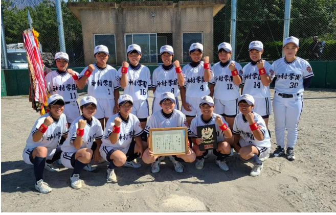
優勝・神村学園中等部