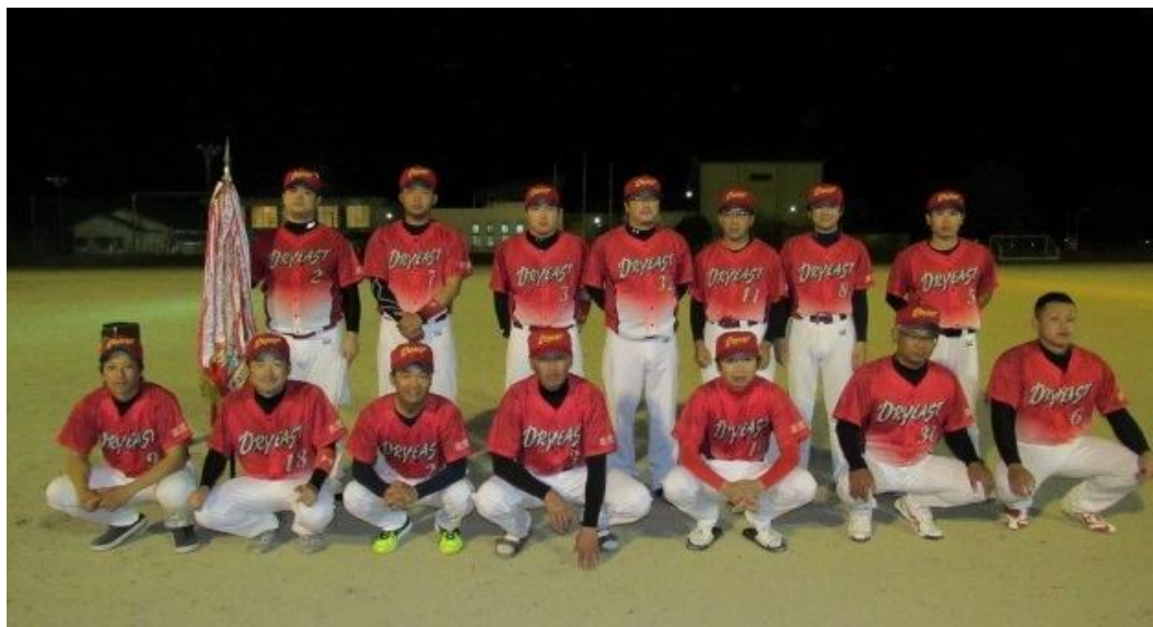
Aクラス優勝・ドライイースト