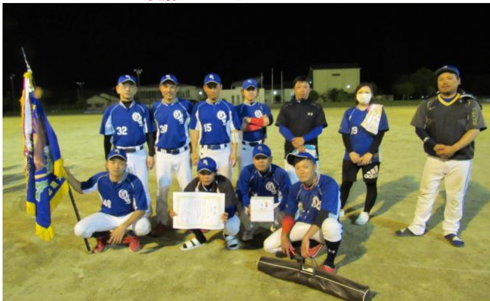
Aクラス優勝・大口電子SC