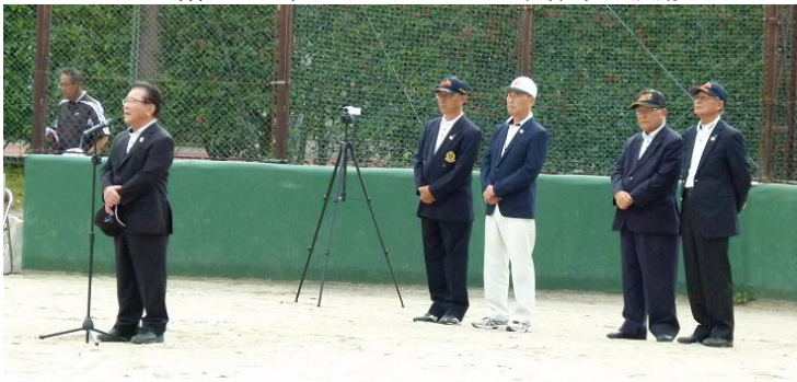
霜出 県ソフトボール会長 挨拶